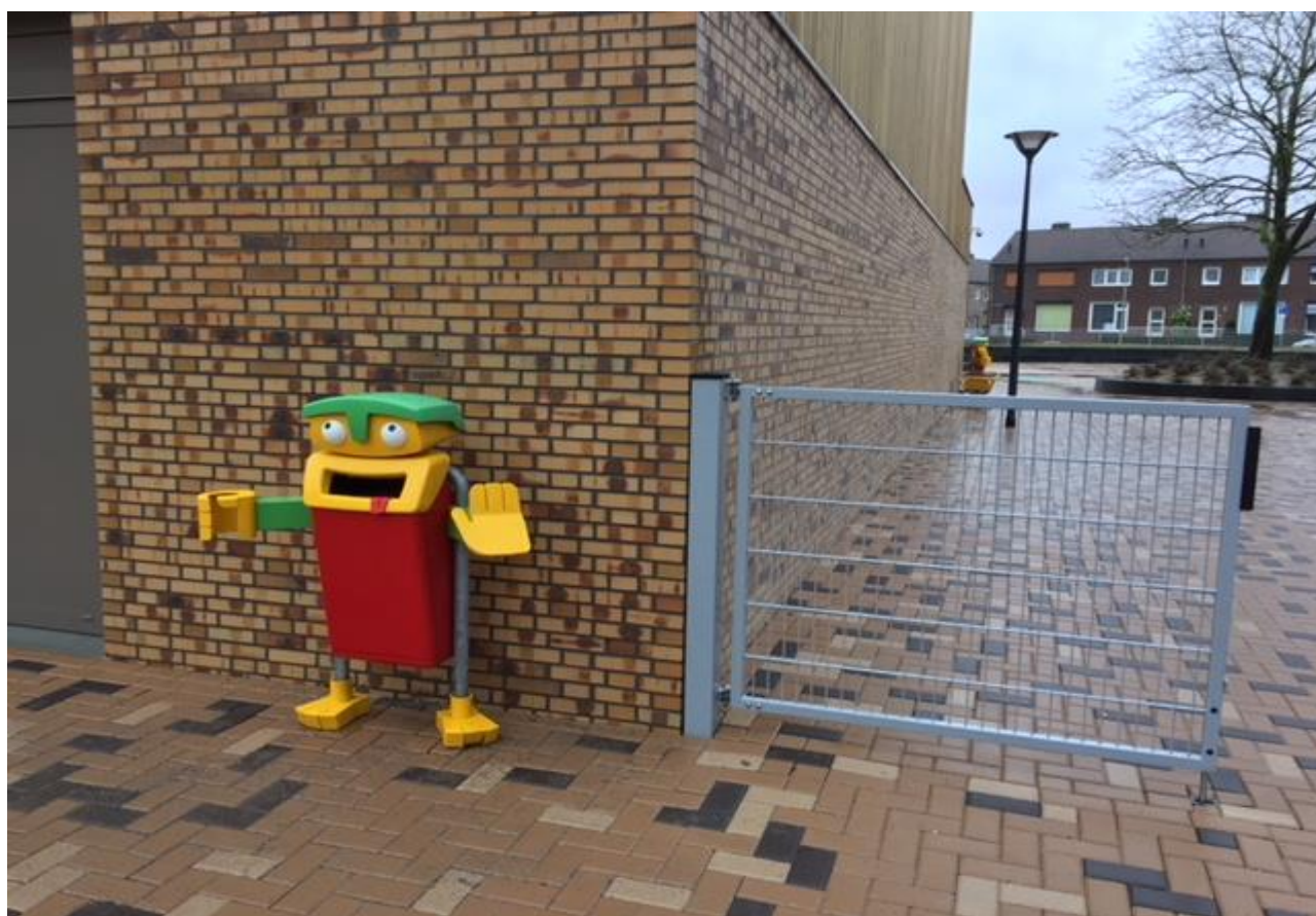
Robot-afvalbak op de speelplaats

Verder heeft de school een grote PMD-afvalcontainer mogen ontvangen en wordt door de gemeente Heerlen de speelplaats voorzien van vier Robo-afvalbakken.