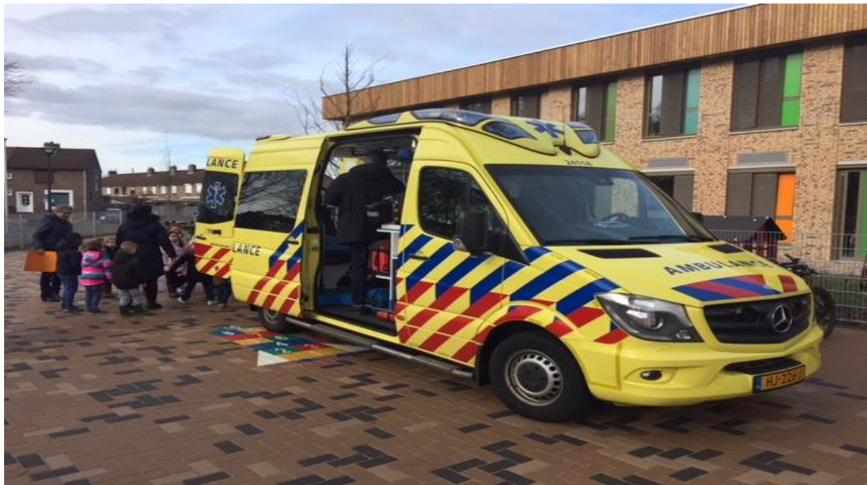
Ambulance op school project "Ziek en Gezond"

Het omgaan met afval (scheiden, verwerken, hergebruiken) past helemaal in de projecten "Terra Nova" van groep 7, "Missie naar Mars" van groep 8, "Wetenschap & Techniek" in de groepen 4 t/m 6, "Ziek en Gezond" van de groepen 1 t/m 2. Groep 3 gaat binnenkort werken in het thema "Kastelen" en bezoekt dan ook kasteel Hoensbroeck.