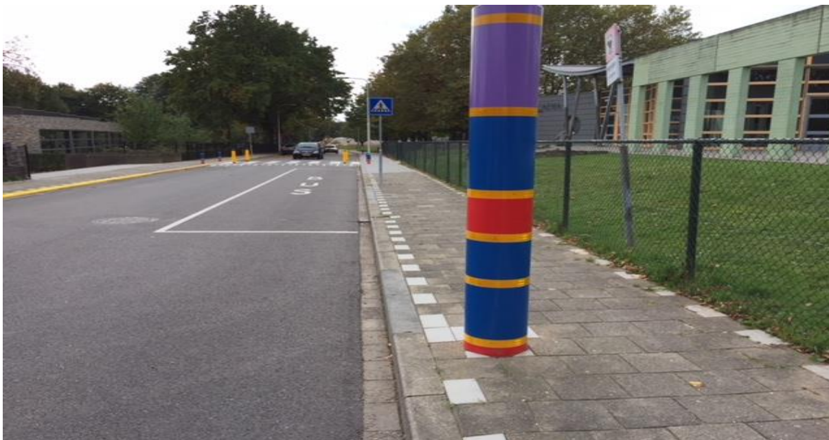
Voorbeeld van een "totempaal" bij een school: opvallend, vrolijk, kleurrijk

Wij vragen uw medewerking met het veiliger maken van de schoolomgeving door voorbeeldgedrag te laten zien en rekening te houden met de aanpassingen. Als het niet echt nodig is, gebruik dan niet de auto, maar kom te voet naar school. Wilt u vooral helpen door de enquête "Verkeersveiligheid" in te vullen. Alvast bedankt.